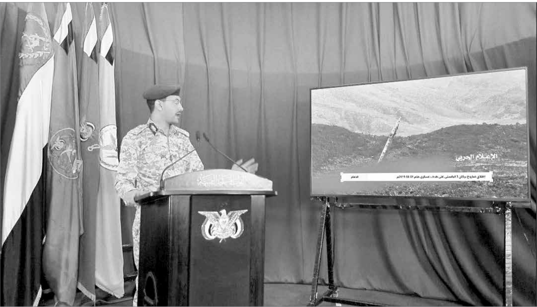
«یجیی سریع»، سخنگوی نیروهای مسلح یمن از دستیابی ارتش این کشور به فناوری های پیشرفته در حوزه موشکی خبر داد

ارتش یمن برای نخستین بار با استفاده از یک فروند موشک پیشرفته «هایپرسونیک»، پایگاه ارتش اسرائیل در نزدیکی تل آویورا هدف قرار داد.